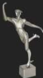
Mercur Award Innovationspreis der Wirtschaftskammer Wien für AirKey, 2014