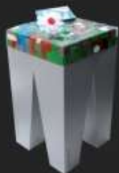
TRIGOS Award Die Auszeichnung für Corporate Social Responsibility, 2012