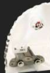
Umweltpreis der Stadt Wien Für die ölfreie Clean Production, 2011