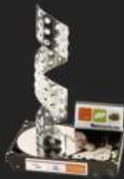
ÖKOPROFIT Auszeichnungen Die Auszeichnung der Stadt Wien für erstklassiges Umweltmanagement. EVVA ist jährlicher Gewinner seit 1999.