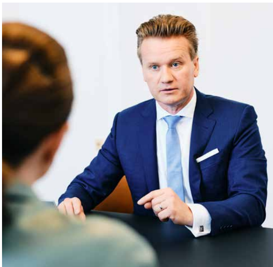
Georg Knill ist Präsident der Industriellenvereinigung

Europäische Herausforderungen, brauchen europäische Antworten. Wir fordern daher einerseits eine Entkoppelung des Gaspreises