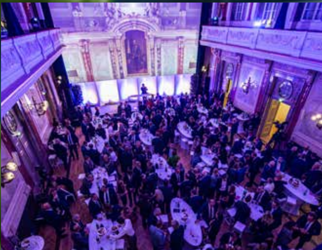
INDUSTRIELAND ÖSTERREICH Mehr als 400 Persönlichkeiten feierten den Tag der Industrie 2022 Seite 5

Österreichische Post AG, MZ 03Z034897 M Vereinigung der österreichischen Industrie, Schwarzenbergplatz 4, 1030 Wien