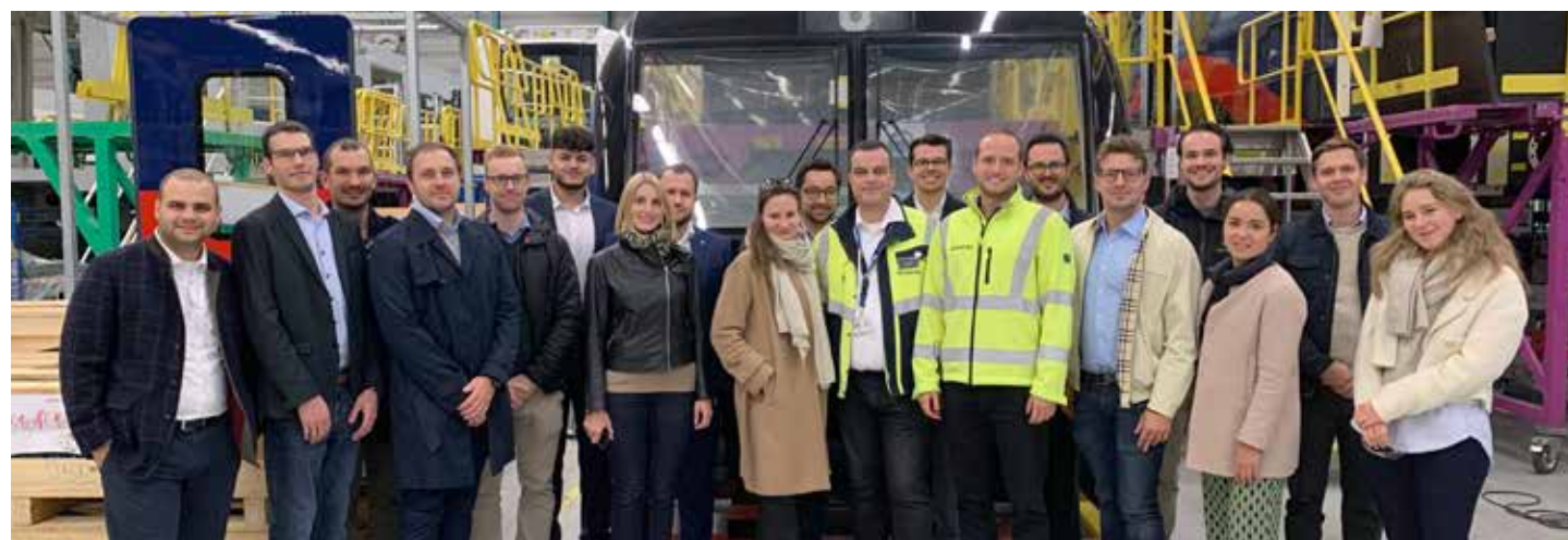
Mitglieder der JI-Wien und JI-NÖ/Bgld

sowie Nahverkehrs- und Regionalzüge für den Einsatz in den verschiedensten Ländern und Städten fertiggestellt werden.