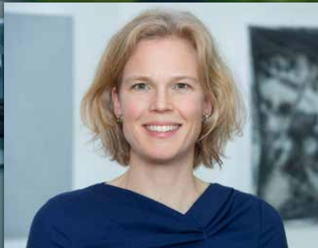
INNOVATION KI, Daten und Digital Skills – jetzt die Weichen für die Zukunft stellen Seite 8