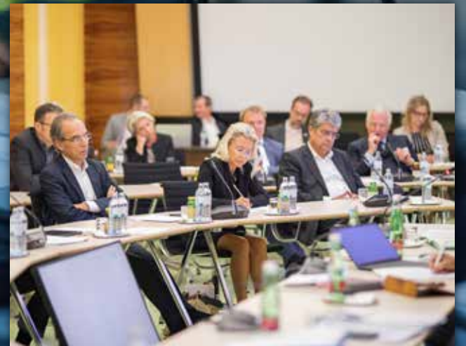
WIEN Energiekrise Hauptthema beim IV-Wien Vorstand Seite 10